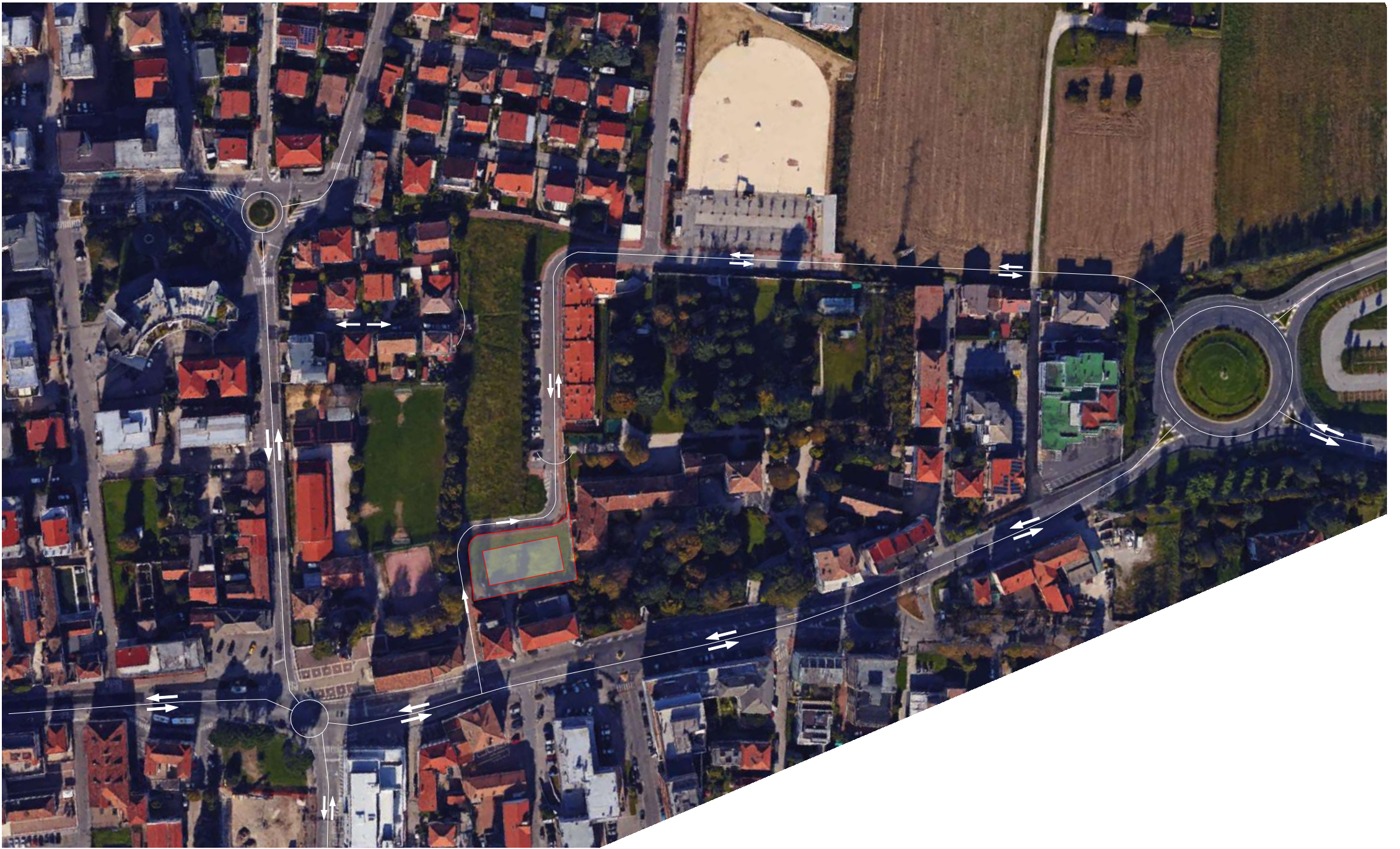
SISTEMA VIABILISTICO PRINCIPALE - STATO DI FATTO